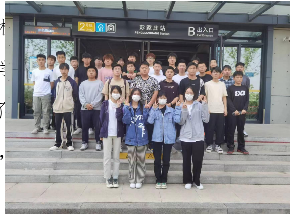
中铁十四局集团有限公司工地实习