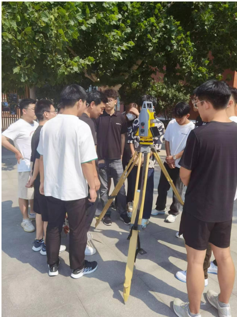
测量协会日常训练

引广大同学积极参与其中，加深了大家对专业的认识，培养了广大学生的兴趣爱好，拓宽了大家的视野。